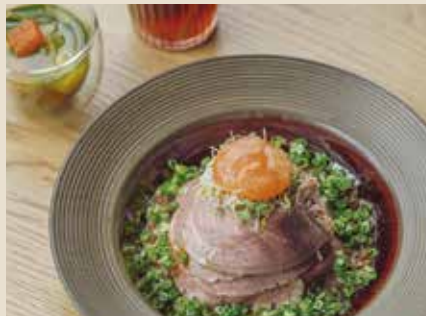
イベリコ豚のコンフィ丼 1540 黒シヤリアピンソースと卵黄コンフィ添え

厳選したサンマルツァーノ品種のトマトと香味野菜を、じっくりコトコト煮込んだシェフ自慢のトマトソース。幻の Pasta「ヴォイエロ」と一緒に食べれば...気分はまさに王様です。 +200でグルテンフリーパスタに変更可能