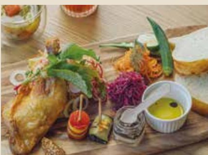
骨付き鶏モモ肉コンフィの デリカテッセプレート 1520

しっとり＆ジューシーに、皮目はパリッと仕上げた鶏モモ肉に、ピンチョス、サラダ、自家製フォカッチャ等々...盛りだくさんなデリカテッセプレートです。