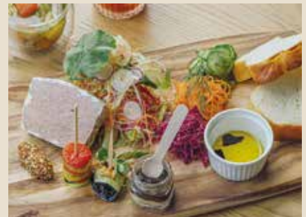
シェフ特製パテ デリカテッセプレート 1520

大豆ミートと香味野菜の煮込みソースに、たっぷりの野菜を合わせた華やかなライスサラダです。