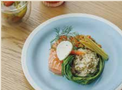
アトランティックサーモンのミ・キュイと ラタトゥイユのリゾット 1320

しっとり火を入れた半生状態のサーモンと野菜の旨味たっぷりの塩味リゾットです。リゾット専用米使用。