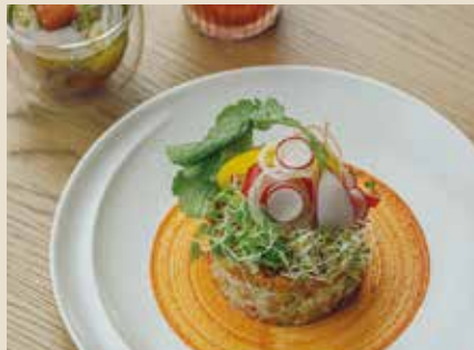
大豆のラグーと藤岡産香り米“プリンセスサリイ” 使用のライスサラダ ガトー仕立て 1210

しっとり火を入れた半生状態のサーモンと野菜の旨味たっぷりの塩味リゾットです。リゾット専用米使用。