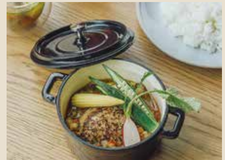
自家製塩麩のココットハンバーグ 1210 w/ライス or フォカッチャ

イベリコ豚最高ランク“ベジョータ”をオリーブオイルとともに低温調理。生肉のように見えますが、火は通っています。バルサミコ酢を使用した和風オニオンソースと酸味がきいた卵黄のコンフィが好相性。