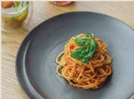
スパゲティ“王様ポモドー” 990 w/フォカッチャ

厳選したサンマルツァーノ品種のトマトと香味野菜を、じっくりコトコト煮込んだシェフ自慢のトマトソース。幻の Pasta「ヴォイエロ」と一緒に食べれば...気分はまさに王様です。 +200でグルテンフリーパスタに変更可能